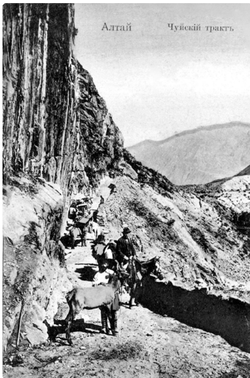
Алтай. Чуйский тракт. Почтовая карточка. Начало XX в.

Во исполнение резолюции Его Преосвященства, положенной на указе Святейшего Правительствующего Синода, от 15 октября 1903 г. за № 14, Консистория мнением своим полагает: ...3) открыть священно-церковнослужительские вакансии при следующих монастырских церквях и церквях, находящихся при учреждениях гражданского ведомства: ...при Бийском Тихвинском