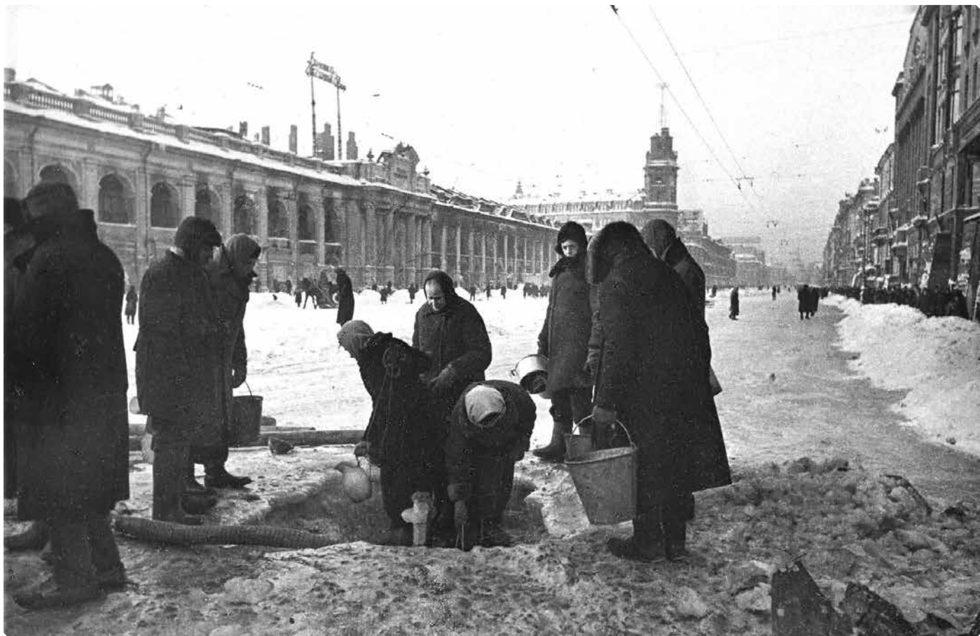
Горожане набирают воду, появившуюся после артобстрела в пробоинах на проспекте 25-го Октября (так с 1918 г. по 13.01.1944 г. именовался Невский проспект).