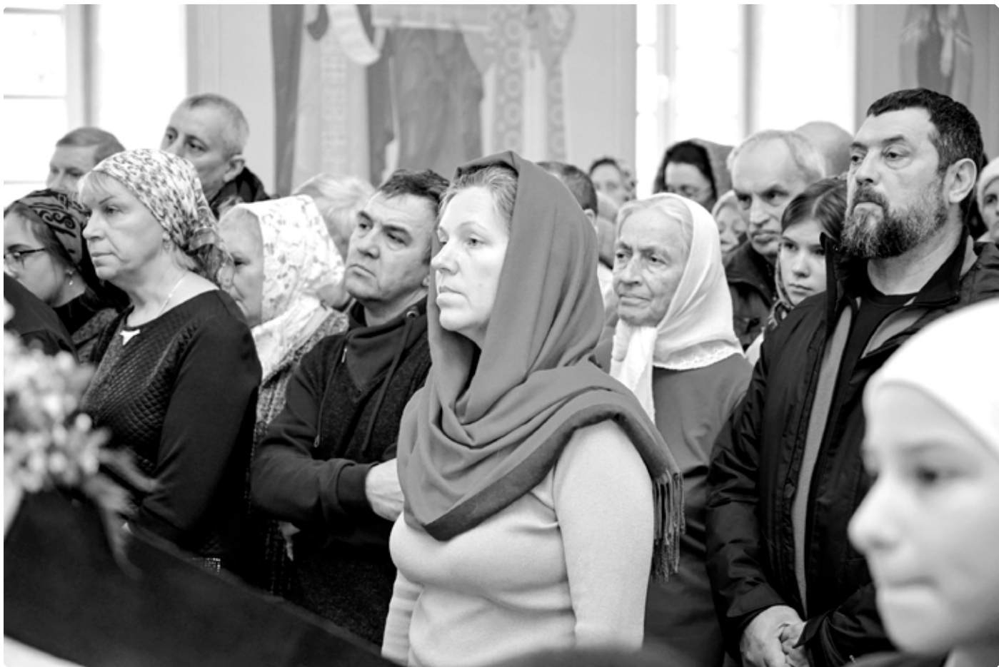
Прихожане. Храм апостола Иоанна Богослова и праведного Иоанна Кронштадтского Бийской православной школы. 2 января 2024 г.