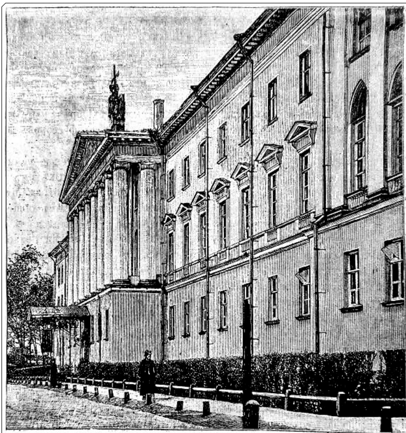
С.-Петербургская духовная академия.

Молитесь об упокоении всех архиереев, священников и диаконов, о которых мы из номера в номер вспоминаем на страницах рубрики «Наша история». Это они крестили наших прадедов, дедов и наших родителей. Это они, верные Богу честные пастыри, без усталости служили, исповедовали и причащали наших предков, венчали их, делили с ними радость чадорождения и горечь утрат. Это они, честные труженики нивы Христовой, в стужу и зной, не считаясь с долгим