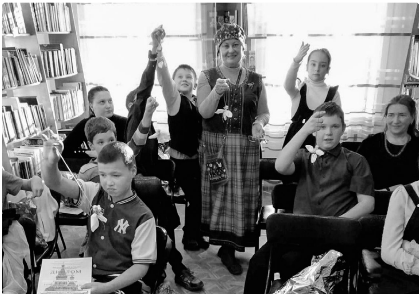
Победители VII Детского литературного конкурса «Свет Вифлеема» на рождественском празднике. Село Сротки. Мемориальная библиотека В.М. Шукшина. 17 января 2024 г.

Координатор конкурса Татьяна Сизинцева