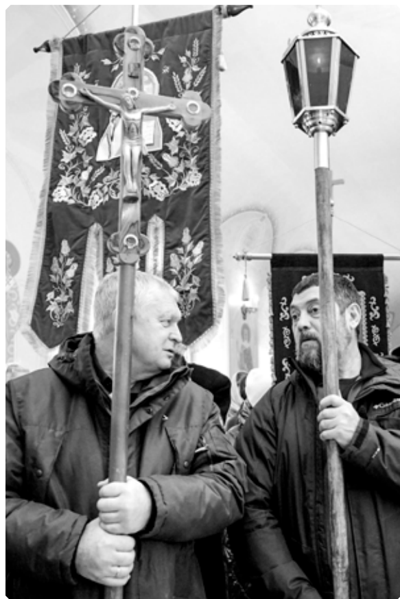
Хоругвеносцы праздничного крестного хода. Домовый храм Бийской православной школы. 2 января 2024 г.

Иван Литвинов