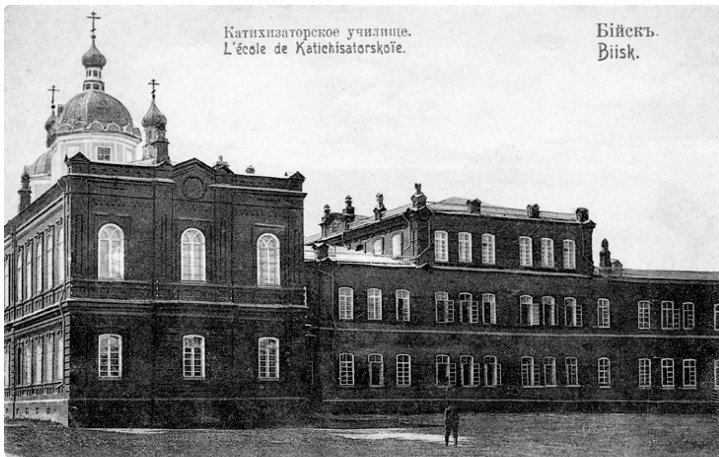
Здание Бийского миссионерского катехизаторского училища. 1910-е гг. Почтовая карточка.

“Новое, сейчас освященное здание училища