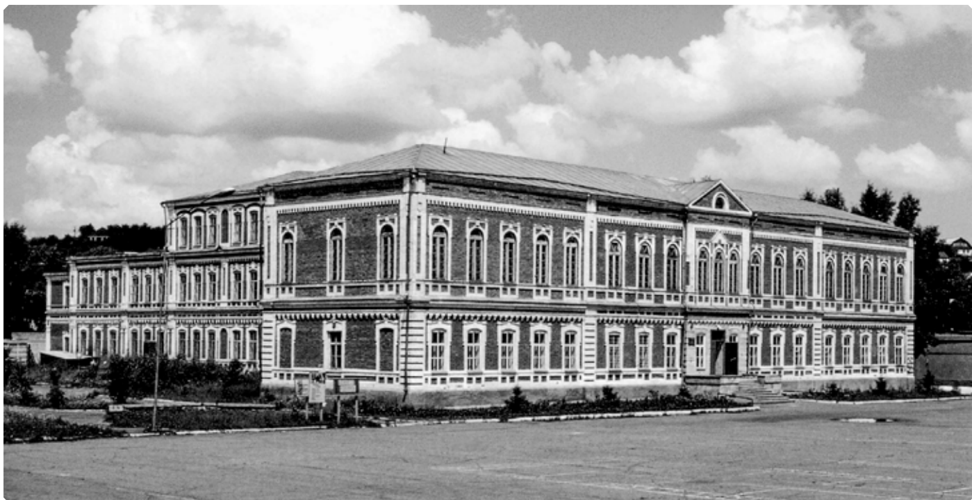
Здание бывшего Бийского миссионерского катехизаторского училища. Начало 1990-х гг.

Уроки велись по духу, методу и объему преподавания согласно с указаниями, данными