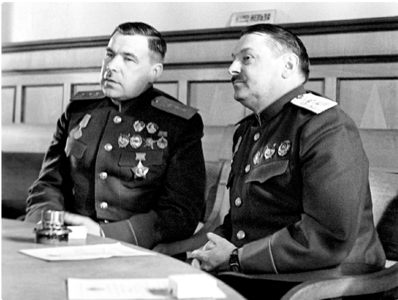
Встреча командующего Ленинградским фронтом генерал-полковника Леонида Говорова (слева) и первого секретаря Ленинградского обкома ВКП(б), члена Военного совета Ленинградского фронта генерал-лейтенанта Андрея Жданова в дни блокады. Июль 1943 года.