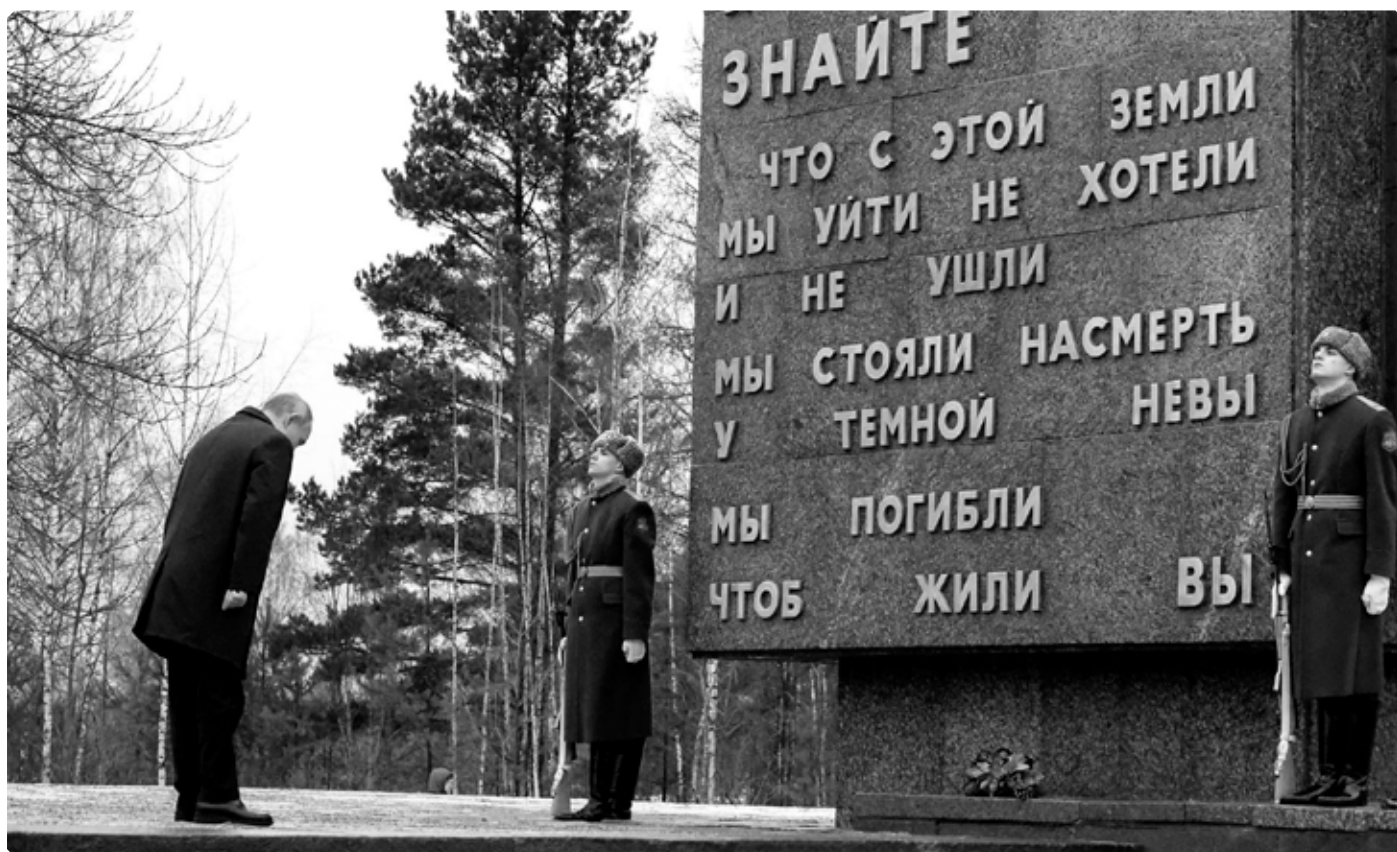
Президент России В.В. Путин возложил цветы к памятнику «Рубежный камень». Мемориальный военно-исторический комплекс «Невский пятачок». Ленинградская область. 18 января 2023 года.