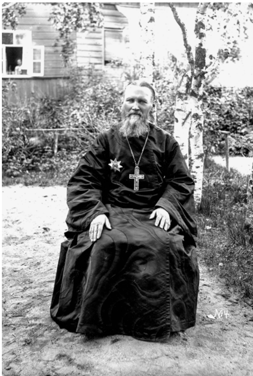
Праведный Иоанн Кронштадтский в саду своего дома. 1899 г.

Он мог, указывая на иконы, сказать, как сказал с небесной улыбкой на лице незадолго до смерти дивный саровский старец Серафим: «Вот мои родные». Небо было для него более близкой областью, чем земля. Здесь, на земле, он казался залетным гостем райской стороны», – писал Евгений Поселянин,