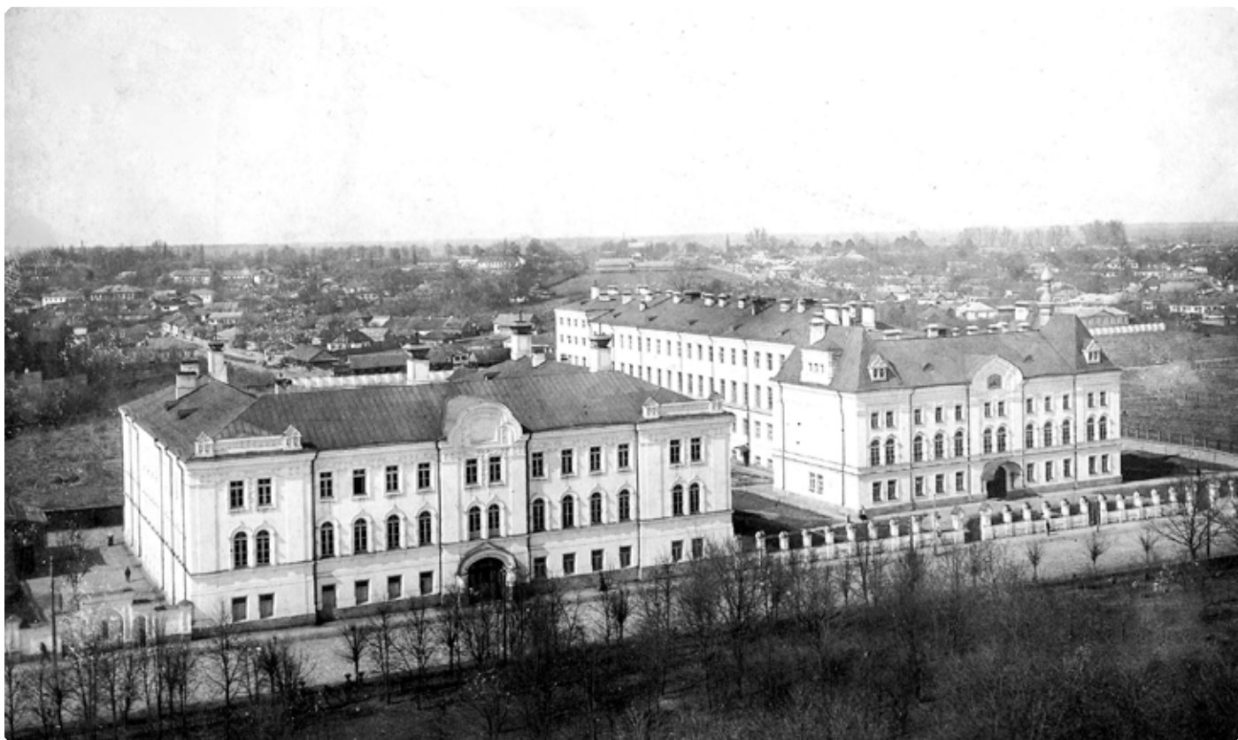
Волынская духовная семинария. Город Житомир Волынской губернии Российской империи. 1902–1914 гг.