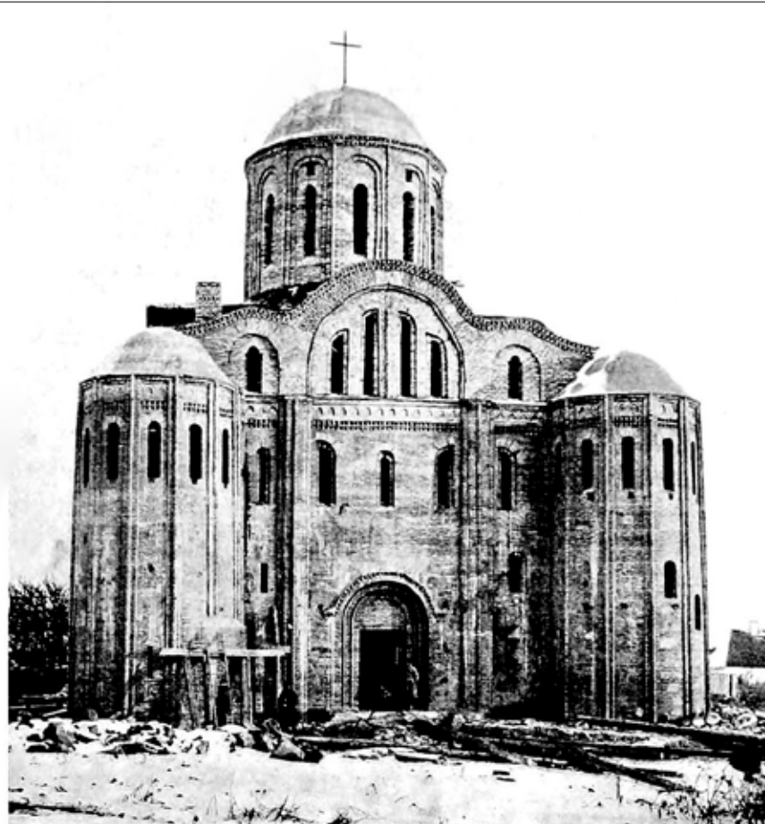
Церковь св. Василия в Овручѣ. (Середина 12-го вѣка).